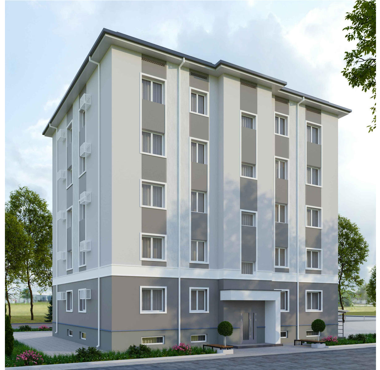
НАМУНАВИЙ ҚАВАТ ТАРХИ