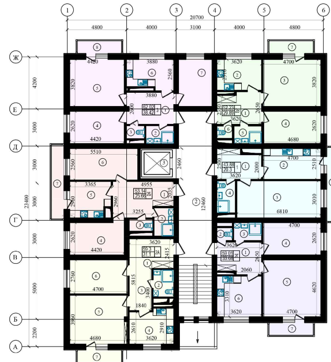
ЭКСПЛИКАЦИЯ ПОМЕЩЕНИЙ (2-7 этажа)