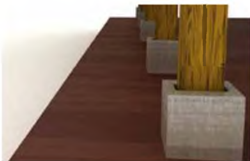
6.2-расм. Айвон устунининг пойдевор билан бикр боғланиши

Ёғоч ёки металл устунларнинг пастки қисми эса зилзила пайтида силжиб кетмаслиги учун пойдеворнинг юқори қисми билан бикр боғланиши лозим (6.2-расм).